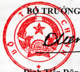
Đinh Tiên Dũng